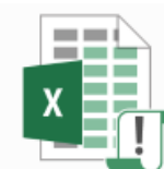
Lignes Directrices de Gestion.xlsx

Il pourra vous adresser un fichier Excel comprenant une feuille « LDG » qui sera déjà alimentée par les données du Bilan Social 2019 de votre collectivité.